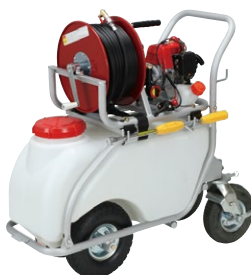
AT-50 + EP-100SM (アルミフレーム)