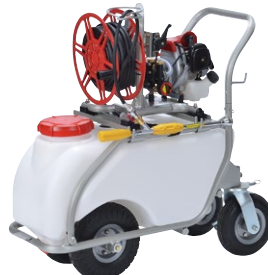
AT-50 + EP-100DM-20 (アルミフレーム)