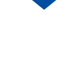
AT-50S + EP-161GB + ムカデ噴口 (スチールフレーム)