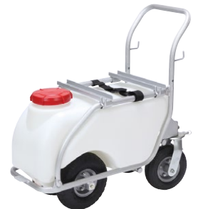
50ℓタンク車 AT-50「コロタン」 (アルミフレーム)