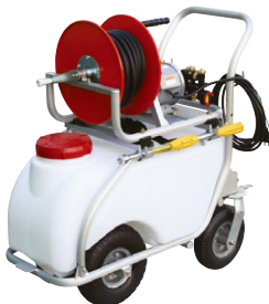
AT-50 + MP-391AM (アルミフレーム)