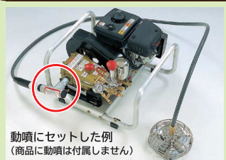
動噴にセットした例 (商品に動噴は付属しません)