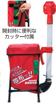
開封時に便利な カッター付属