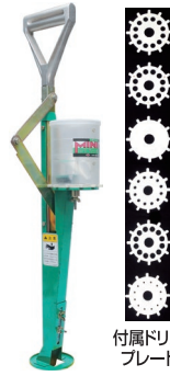
付属ドリル プレート