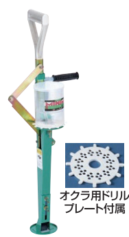
オクラ用ドリル プレート付属