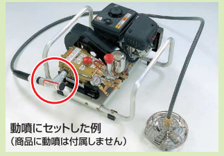
動噴にセットした例 (商品に動噴は付属しません)