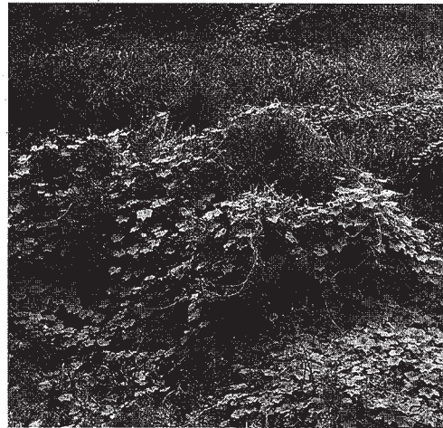
オオバタクサとアレチウリ

【警戒すべき難防除雑草】 現在、問題となっている雑草の中で、特に警戒すべき難防除雑草を以下に示す。 オオバタクサは生育が非常に早く、大型で高さ3〜6mになる。全国各地で分布が確認されており、関東地方以南の多 【警戒すべき難防除雑草】 現在、問題となっている雑草の中で、特に警戒すべき難防除雑草を以下に示す。 オオバタクサは生育が非常に早く、大型で高さ3〜6mになる。全国各地で分布が確認されており、関東地方以南の多